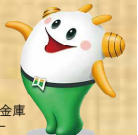
北おおさか信用金庫 公式キャラクター

事前のご相談は、上の電話番号にお問い合わせください。また、最寄りの本支店にご予約の上で来店をおすすめします。