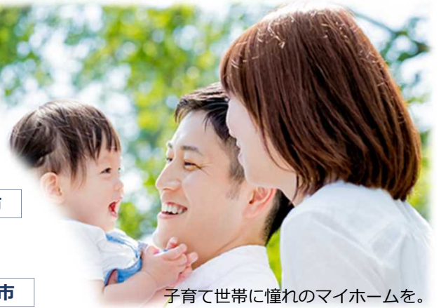
子育て世帯に憧れのマイホームを。 マイホーム取得で地方移住の夢を現実に。