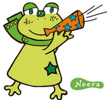
韮崎市イメージキャラクター ニーラ