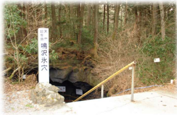
鳴沢氷穴（天然記念物）