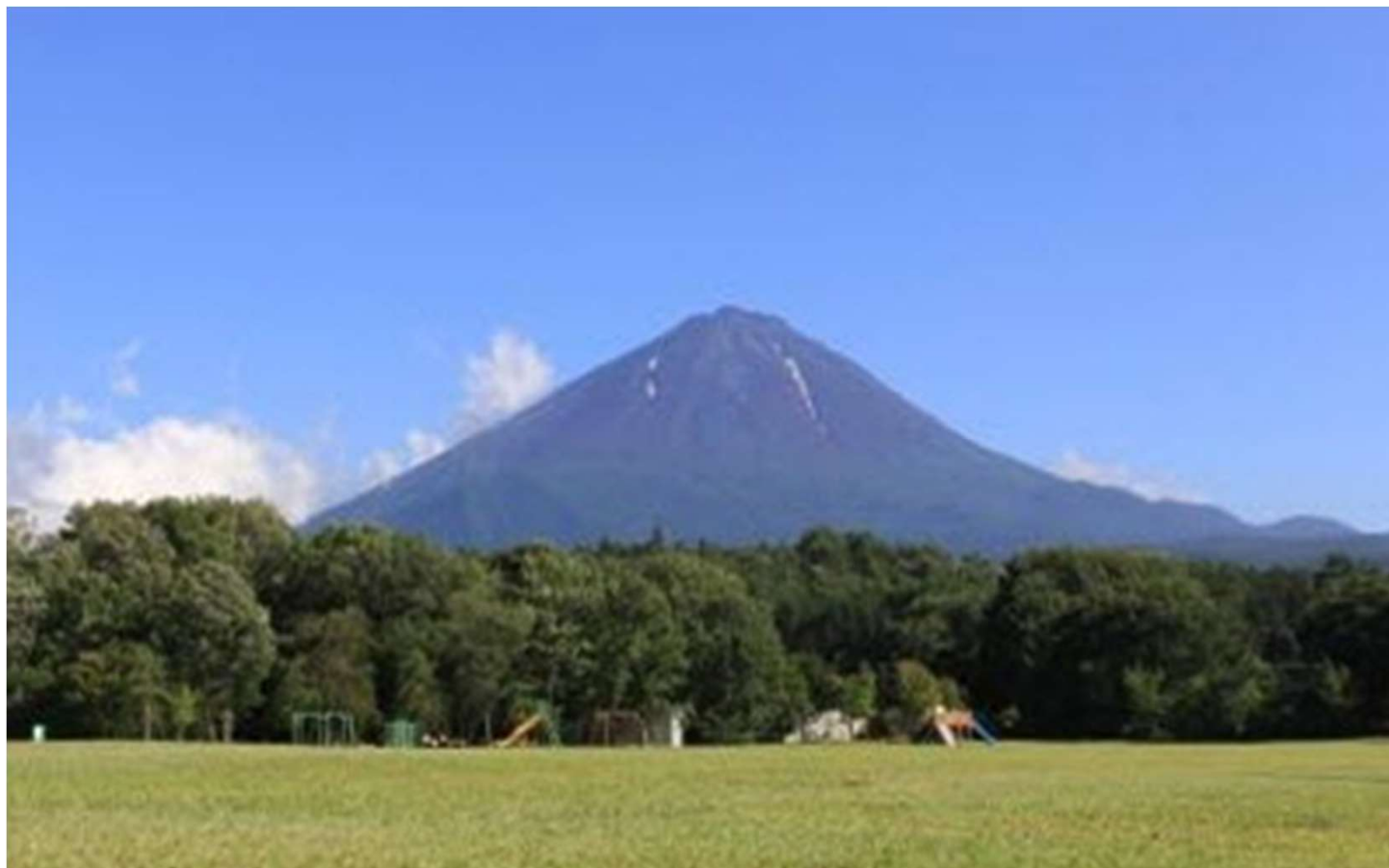
鳴沢村生き生き広場からの富士山眺望