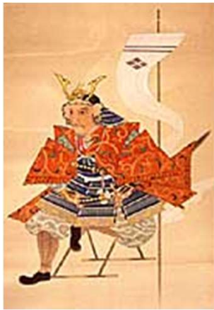
南部町は、 奥州の豪族・南部氏の発祥の地