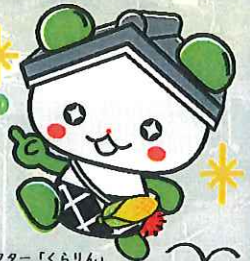
村田町観光PRキャラクター「くらりん」

子育て世帯や転入世帯へ 最高200万円の補助金も! 魅力だりん♪ ※詳しくは裏面へ